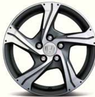
17" & 18" ARGON