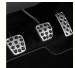
PÉDALES SPORT EN ALUMINIUM

Adaptation automatique de la hauteur du faisceau (HSS)