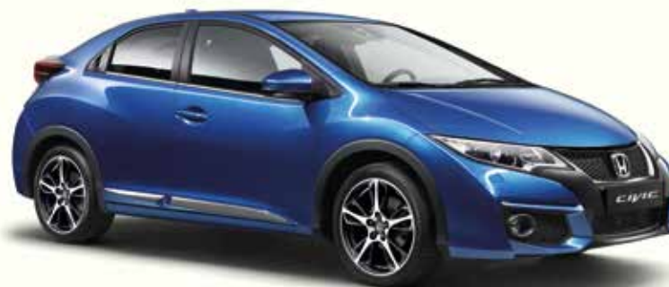
L'illustration inclut des jantes de 18" Hydrogen en alliage