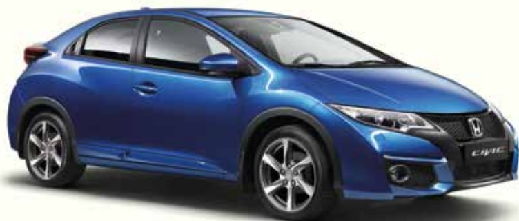
L'illustration inclut des jantes de 17" Cobalt en alliage

Comme il se doit pour des équipements signés Honda, chaque option a été développée, testée et fabriquée pour garantir un maximum de sécurité, de protection et de longévité. Développées en même temps que la Civic elle-même, ces options répondent aux mêmes normes de qualité et de fiabilité. Et chaque accessoire a été pensé pour s'adapter au style de la Civic.