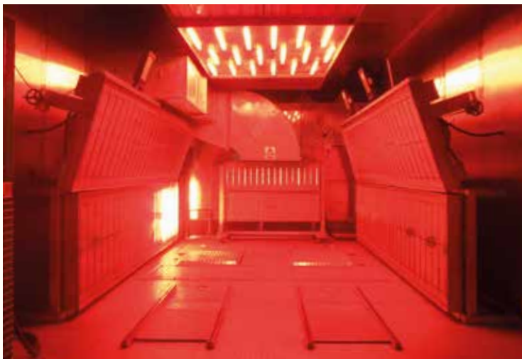
La chambre d'essai climatique dans l'usine Honda de Swindon.

La sensation de confort ne se limite pas au design intérieur, le sentiment de sécurité y joue aussi un grand rôle. En plus de ses performances haut de gamme, la Civic embarque également des équipements de sécurité à la pointe de la technologie.