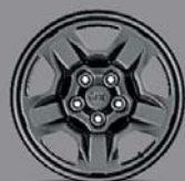
Jantes acier 16" Original