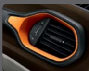
513 - Cuir Freefall Inserts Anodized Orange