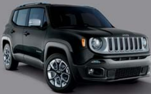
Carbon Black Métallisé - 876