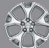
Jantes alliage 18" Adventured