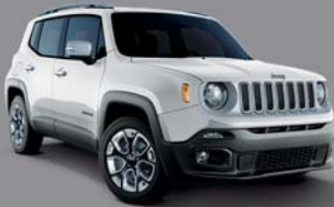
Alpine White - 296