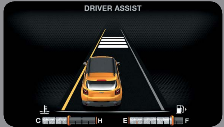
SYSTÈME D'AVERTISSEMENT DE FRANCHISSEMENT DE LIGNE AVEC CORRECTION