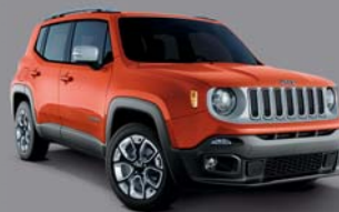
Omaha Orange - 562