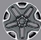
Jantes alliage 17" Trail Rated