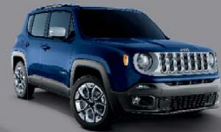
Jet Set Blue - 888