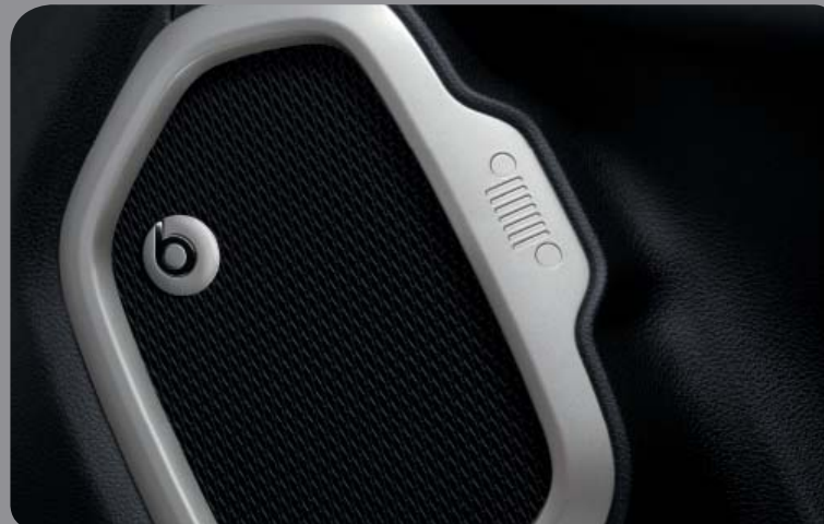
SYSTÈME AUDIO PREMIUM BEATS® BY DR. DRE 9 HAUT-PARLEURS ET 506 W