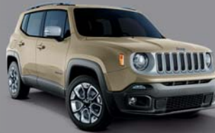
Mojave Sand - 231