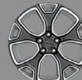
Jantes alliage 18" Freedom