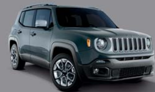
Anvil - 385