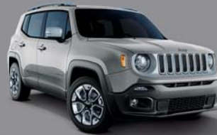
Glacier Métallisé - 348