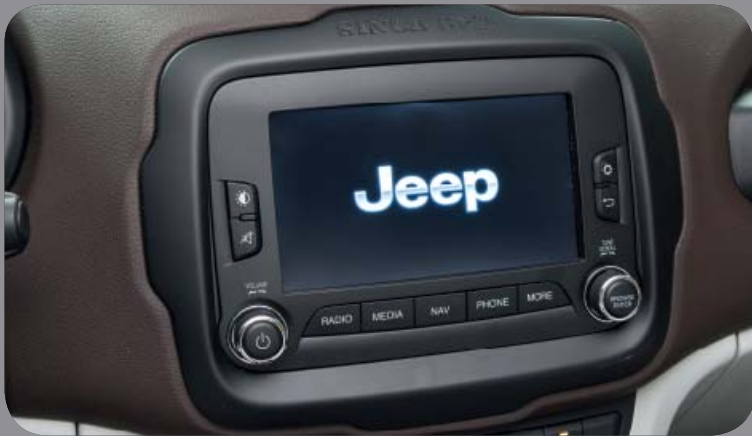
SYSTÈME DE NAVIGATION UCONNECT Live® 6,5"