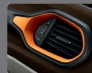
134 - Tissu Freefall Inserts Anodized Orange