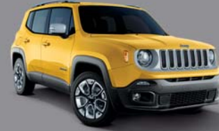
Solar Yellow - 178