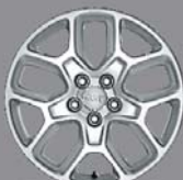
Jantes alliage 17" Passion