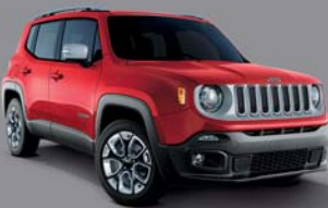
Colorado Red - 176