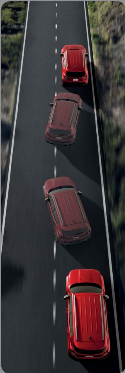
SYSTÈME D'AVERTISSEMENT DE FRANCHISSEMENT DE LIGNE AVEC CORRECTION