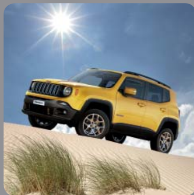
LONGITUDE LONGITUDE BUSINESS