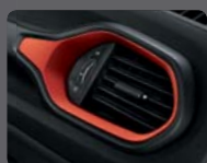
149 - Tissu Trailhawk Inserts Ruby Red