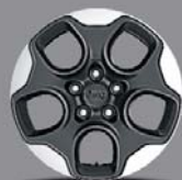
Jantes alliage 16" Authenticity