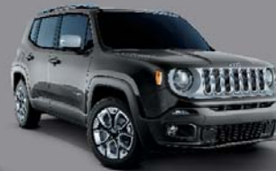
Granite Crystal - 095