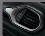
104 - Tissu Sandstorm Inserts Diamond Metal