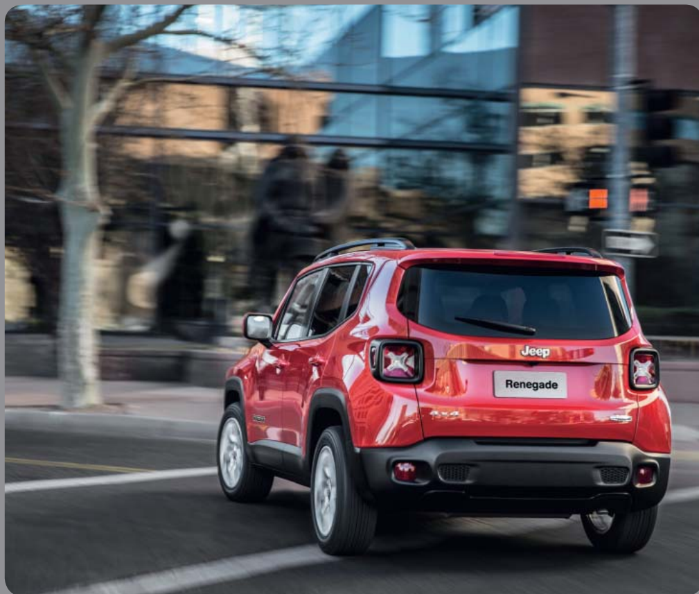
SYSTÈME DE SURVEILLANCE DES ANGLES MORTS