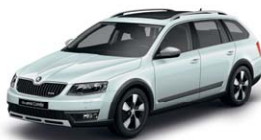
Blanc Lune 2Y2Y