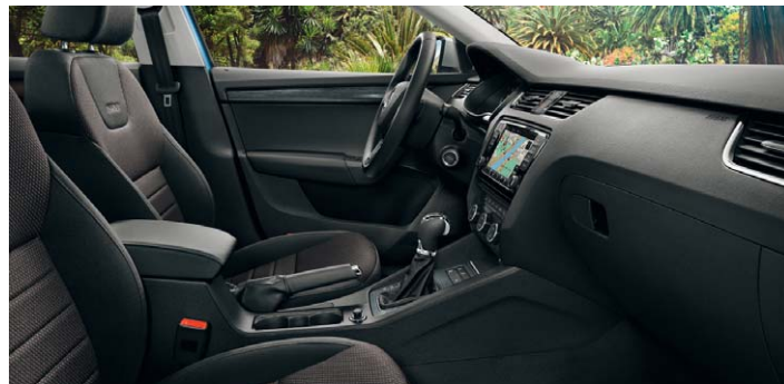
Sellerie tissu noir/brun, tableau de bord noir.