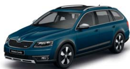
Bleu Pacific Z5Z5