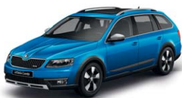
Bleu Racing 8X8X