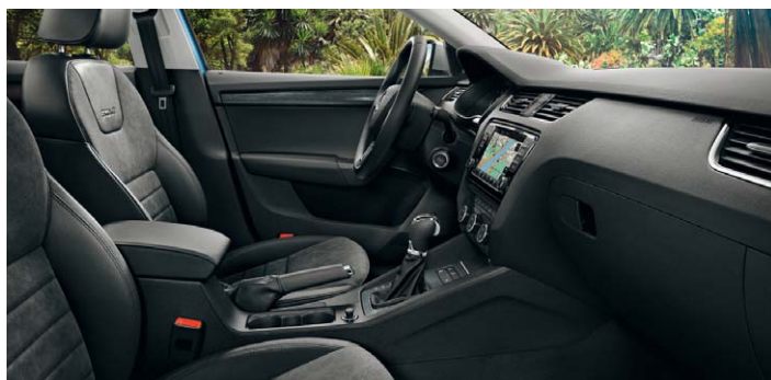
Sellerie cuir-Alcantara noir, tableau de bord noir.*