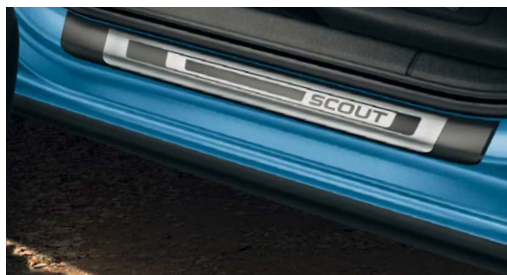
Seuils de porte gravés "SCOUT".