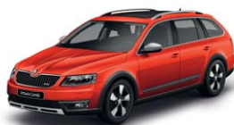
Rouge Rio 6X6X