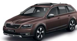
Marron Topaze 4L4L