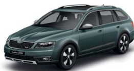
Gris Météore F6F6