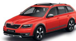
Rouge Corrida 8T8T