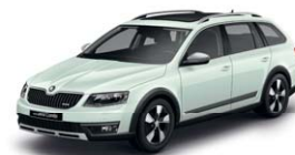
Blanc Laser J3J3