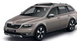
Beige Cappuccino 4K4K