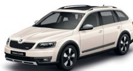
Blanc Cristal 9P9P