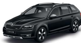
Noir Magic Nacré 1Z1Z