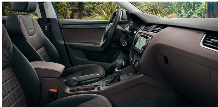
Sellerie tissu noir/brun, tableau de bord noir/brun.