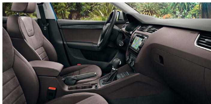
Sellerie cuir-Alcantara brun, tableau de bord noir/brun.*