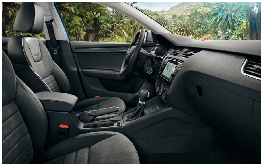
Volant 3 branches multifonctions.

L'Octavia Scout se dote tout d'abord d'un design caractéristique, sa ligne élancée s'appuie sur de robustes revêtements extérieurs, ses jantes alliage 17" "Polar" accompagnées d'un pare-chocs à toute épreuve renforcent cette forte identité tout-terrain. Digne successeur de la ŠKODA Octavia Combi 4x4 de 3 ème génération, elle ne manque pas d'offrir beaucoup d'espace intérieur ainsi qu'une technologie résolument moderne. Son intérieur haut de gamme dispose en effet de nombreux équipements tels que des radars de stationnement arrière, un système mobile Bluetooth ainsi qu'une radio MP3 "Swing" accompagnée de 8 haut-parleurs.