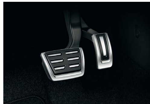
Pédalier aluminium (inclus dans Pack Chrome extérieur).