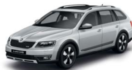
Gris Argent 8E8E