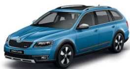
Bleu Denim G0G0